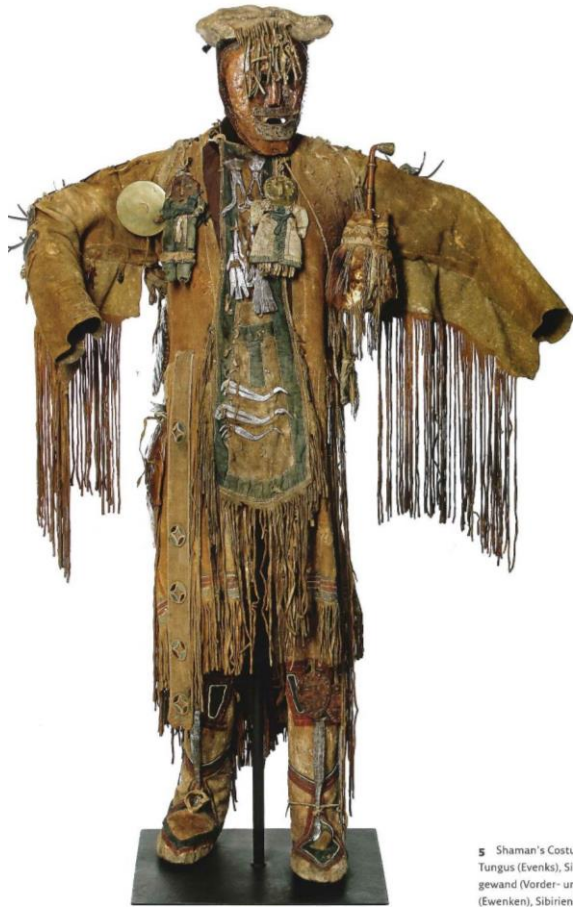
5 Shaman's Costume (back and front), Tungus (Evenki), Siberia | Schamanen- gewand (Vorder- und Rückseite), Tungusen (Ewenken), Sibirien | Cat. 24

Vorderseite eines Schamanengewandes aus Sibirien, Tungusen (Ewenken), Höhe 190 cm, As 957